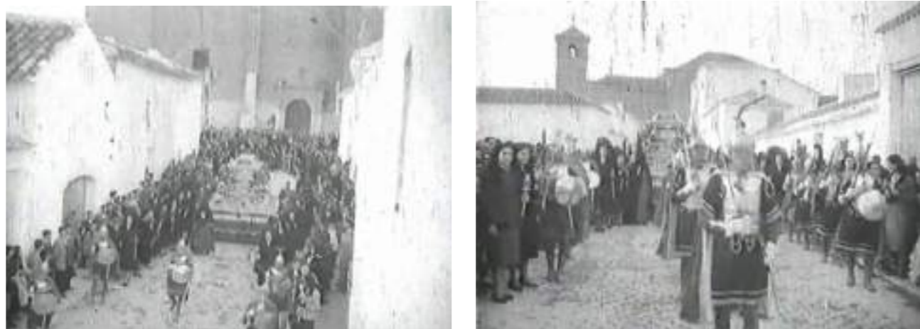
Procesión del Santo Entierro. Socuellamos año 1952

Tras esta especial celebración llegará una de las procesiones más esperadas de la Semana Santa: el Santo Entierro. Durante años esta procesión estaba precedida del llamado Sermón de las siete Palabras, que desde el púlpito disponía a los fieles para acompañar el momento procesional. Desde hace unos años en esta procesión salen todas las imágenes, excepto la de Ntra. Sra. de la Soledad, que saldrá en el Sábado Santo. Tradicionalmente, hasta los tiempos de los hermanos Palop, sacerdotes de esta localidad, la procesión de la Soledad era también el Viernes Santo, y se celebraba al terminar la del Santo Entierro, a la cual también acompañaba la hermandad de la Soledad. Esta tradición se cambió un año por motivos climatológicos, y al ver los sacerdotes la gran afluencia de gente que acompañaba la procesión, y quedándose a celebrar la Vigilia Pascual, se optó por hacerlo así ya de siempre en la tarde del Sábado Santo.