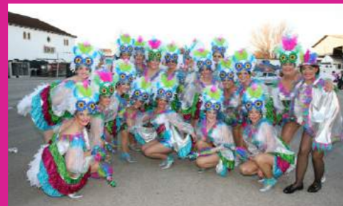
Comparsa "LAS MUSAS"