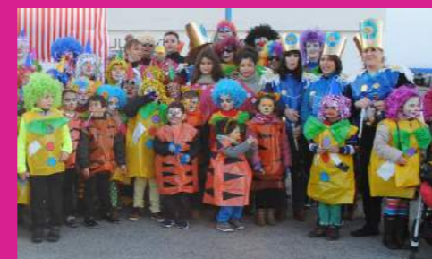
Ampa C.E.I.P GERARDO MARTÍNEZ