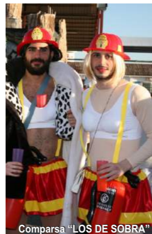
Comparsa "LOS DE SOBRA"

Al término del Desfile en la Carpa Palacio del Carnaval ENTREGA DE PREMIOS Y FIESTA FIN DE CARNAVAL AMENIZADA POR EL D.J. TOLEDO SPEAKER Y SHOWMAN