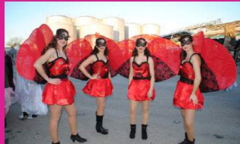
Comparsa "MALE MALE MÍA"