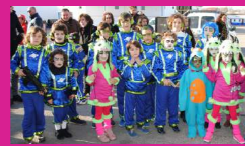
Ampa C.E.I.P EL COSO