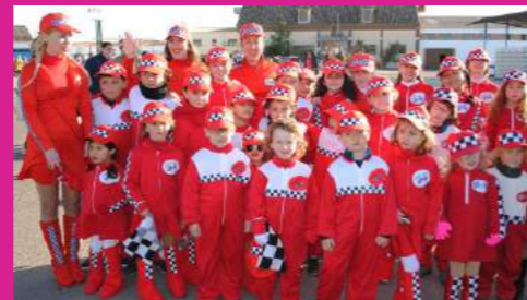
Ampa C.E.I.P CARMEN ARIAS