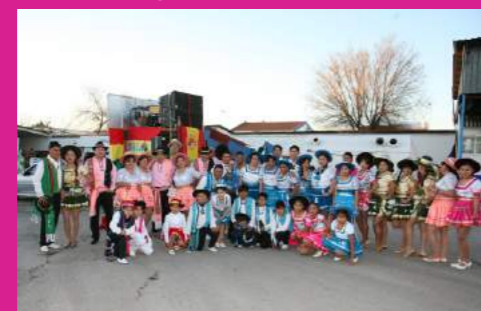
Comparsa "MORENADAS POR SIEMPRE"