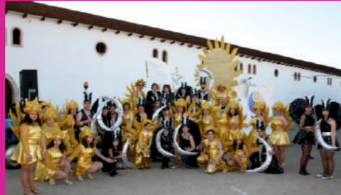
Comparsa "LOS MISMOS"