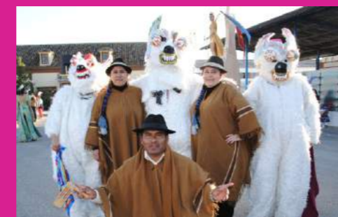
Comparsa "FOLCLÓRICA BOLIVIANA SALAY"