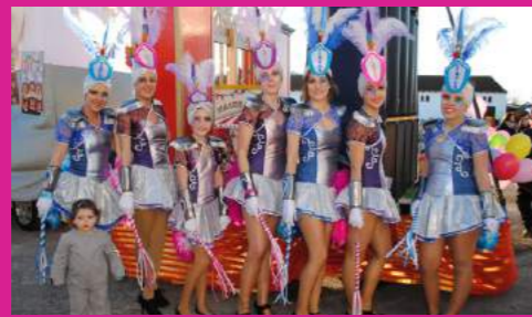
Comparsa "PEÑA MASKE"