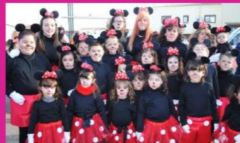
Ampa C.C.VIRGEN DE LORETO